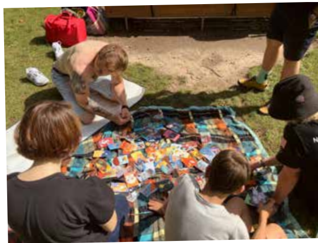
SPOLEČNĚ TO DÁME DOHROMADY

Dobrovolník z Okamžiku tráví volný čas s klientem.