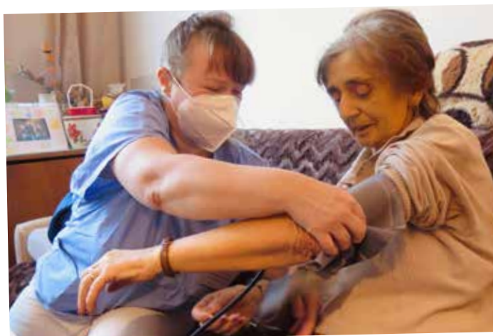
HOSPICOVÁ PÉČE V DOMÁCÍM PROSTŘEDÍ

Nezbytná zdravotní péče u klientky Domácího hospice Setkání.