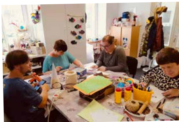
VYRÁBÍME, HRAJEME SI.

Ve SVĚTĚ NADĚJE tráví handicapovaní volný čas tvořením i hrou.