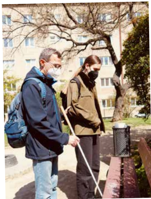
NA PROCHÁZCE S KLIENTEM

Dobrovolník z Okamžiku tráví volný čas s klientem.