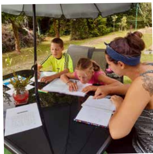
UČÍ (SE) CELÁ RODINA

Autori pomáhá dětem z ohrožených rodin se školní přípravou.