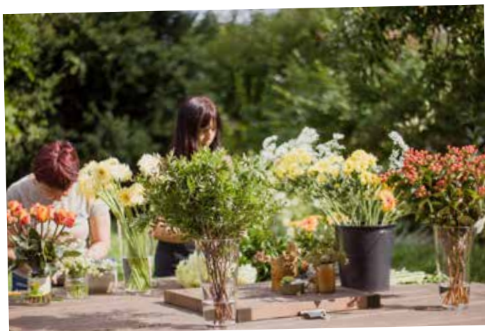
PRÁCE NA ZAHRADĚ

Společnost E pomáhá lidem s epilepsií zapojit se do pracovního života.