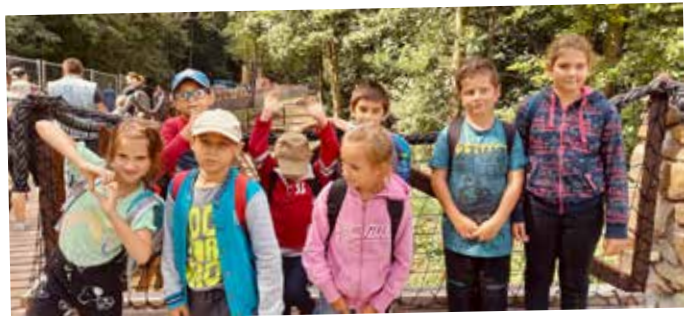
VYRÁŽÍME NA VÝLET!

Dětem v náhradní péči umožňuje Diamant trávit volný čas v přírodě.